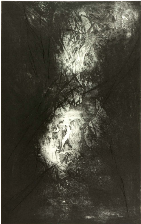
Kerstin Franke-Gneuß Lichtstreif 2011, Aquatinta, Kaltnadel-Radierung, 89 x 55 cm