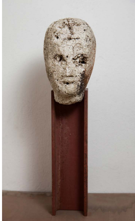
Else Gold Kassandra 2015, Objekt | Eisen, Styropor, 55 x 14 x 20 cm