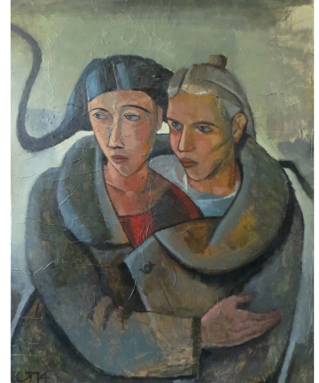
Gudrun Trendafilov Zu zweit im Grau 2014, Mischtechnik, Collage, 90 x 70 cm